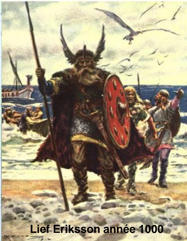
Lief Eriksson année 1000