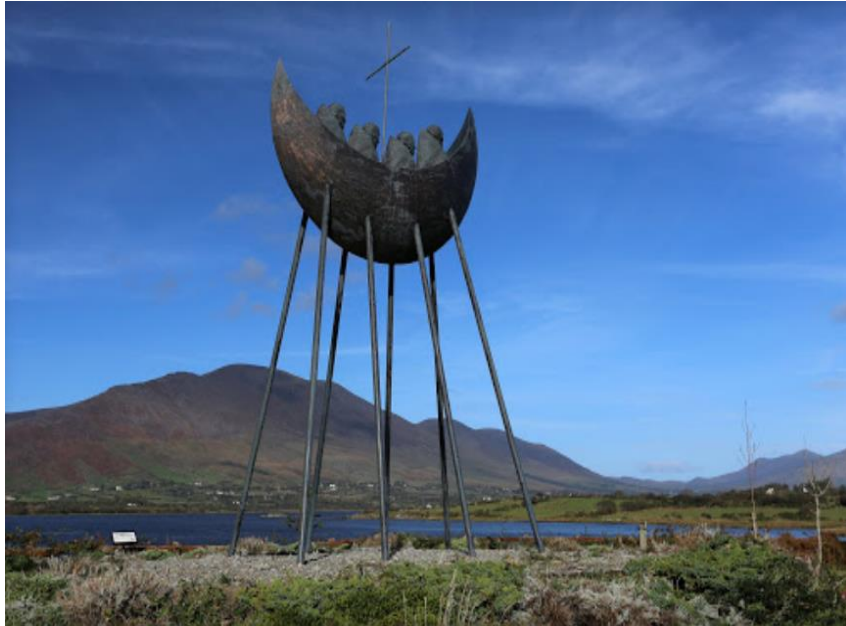
Monument dédié à Saint Brendan situé Comté Kerry, côte Ouest, Irlande

Saint Brendan et ses 17 compagnons accostent à la « Terre promise des saints ». Après l'avoir explorée, ils repartent vers leur point de départ en emportant avec eux des fruits et des pierres précieuses. Il est présumé que Saint Brendan s'est rendu jusqu'à Terre-Neuve en se servant des îles de l'Atlantique Nord comme tremplins vers sa destination.